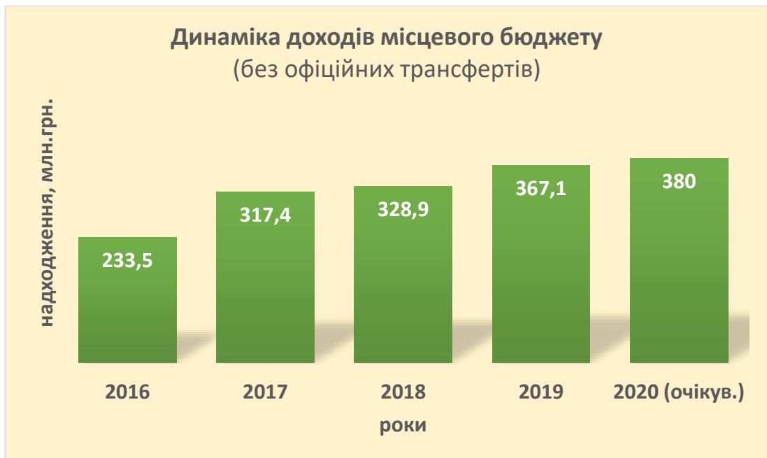
Рис. 3. Динаміка доходів бюджету Слобожанської ОТГ, млн.грн.

В розвиток громади вагомий внесок вносять юридичні особи та фізичні особи-підприємці, як сплачують податки до місцевого бюджету, зокрема, податок на доходи фізичних осіб, акцизний податок, місцеві податки і збори.